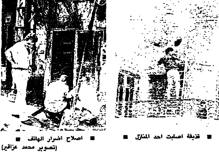
مناطق عيشة بكر بيت اس - اصلاح اضرار الهالك

استمر الحذر في مناطق عيشة بكر، الرمل الطريف، المطار، ومحيط دار الفتوى على رغم توقف الاشتباكات التي وقعت ليل اس الاول بين مسلحين تابعين لحركة «امل» وآخرين من الحزب التقدمي الاشتراكي، ووقعت اضراما فادحة بالممتلكات والسيارات، كما اصاب بعض الذنائب دار الفتوى. تلك استقبل مساحته مفتي الجمهورية الشيخ حسن خالد في داره في عرمن قبل الظهر ممثل حركة «امل» في لجنة التنسيق الامنية لبيروت الغربية المحامي هيثم جمعة، وتداول معه بالاشتيكات المؤسف الذي حصل الليلة الماضية في منطقة عيشة بكر ومحيطها والذي اصيب خلاله باضرار من جراء القذائف بيوت دار الفتوى وعدد من المباني والسيارات في المنطقة. وقد شدد مساحته على ضرورة اتخاذ التدابير التي تحول دون تكرار مثل هذه الاشتباكات التي تبدأ بحادث قربي ثم تتطور الى ضرب للمواطنين وممتلكاتهم وخطر يتهدد وحدة الصف الواحد. ومن جهته وضع المحامي جمعة مفتي الجمهورية في اجراءات لجنة التنسيق، وحرصا على عدم السماح بوقوع اشتباكات في اطراف الصف الواحد. وفي اطار تطويق ذيول هذه الاشتباكات عقد قبل ظهر امس في منزل الوزير وليد جنبلاط اجتماع اممي - عسكري برئاسة رئيس جهاز امن - الحزب الاشتراكي، في بيروت الغربية، عصام عيترازي، ابو سعيد، وحضور بعض المسؤولين العسكريين في حركة «امل» والحزب الاشتراكي وبعض المنظمات الاخرى. ونكر ان مدور العاصفة والاضحية حضورا هذا الاجتماع الاممي الموسع حيث عرض في شكل تفصيلي التنسيق بين الميليشيات المركزية على خطوط القدس، وابعث الى الجسور واستمرار الظهور المسلح في مناطق عيشة بكر، الملا.